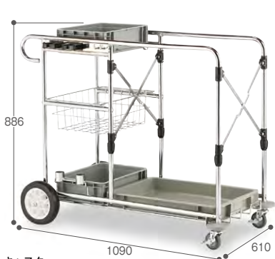
キャスター キャスターは老化しにくく、 床を汚しにくいオレフィン系 エラストマーを使用。