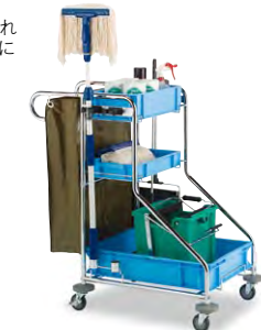
※写真の清掃用品は全て別売です。