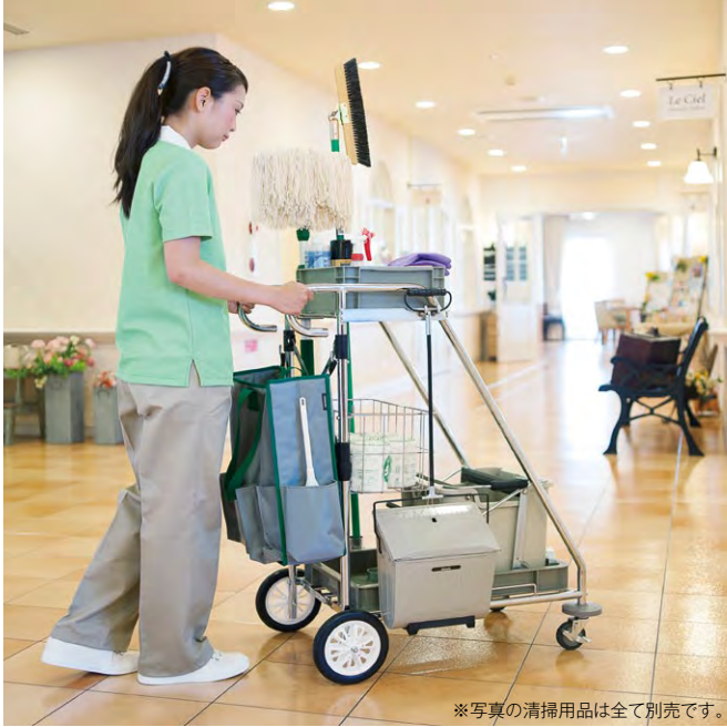
※写真の清掃用品は全て別売です。