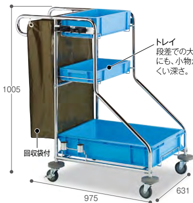
トレイ 段差での大きな揺れ にも、小物が倒れに くい深さ。