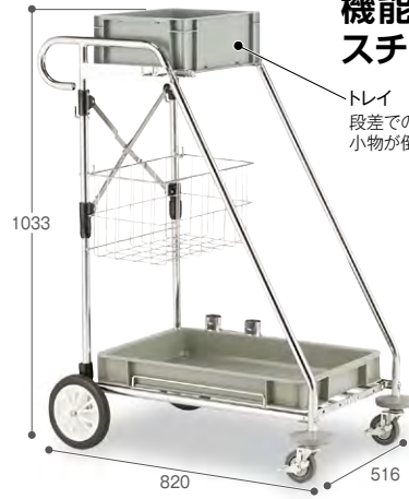
トレイ 段差での大きな揺れにも、 小物が倒れにくい深さ。