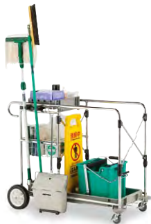
※写真の清掃用品は全て別売です。